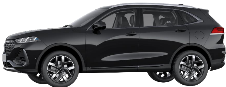
Lava Black (Metallic)