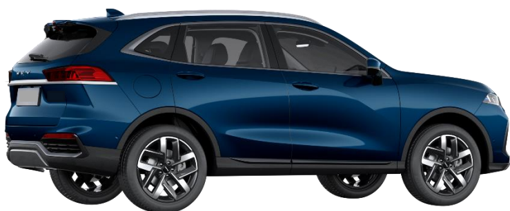
Deep Sea Blue (Metallic)