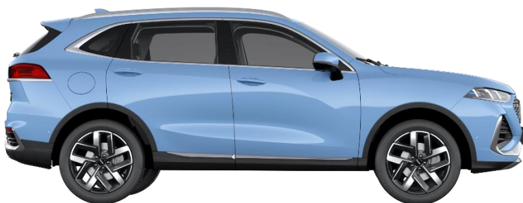
Iceberg Blue (Metallic)