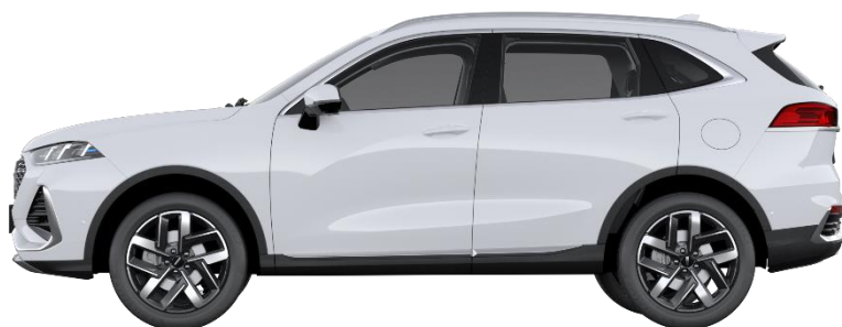
Snow White (Metallic)