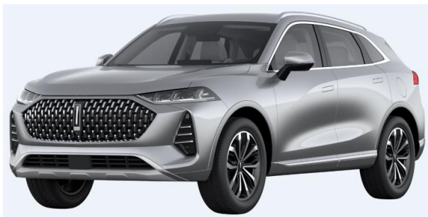
Moonrock Silver (Metallic)