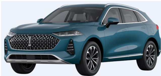
Deep Sea Blue (Metallic)