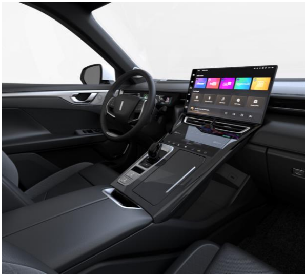
Black serienmäßig für PREMIUM und LUXURY