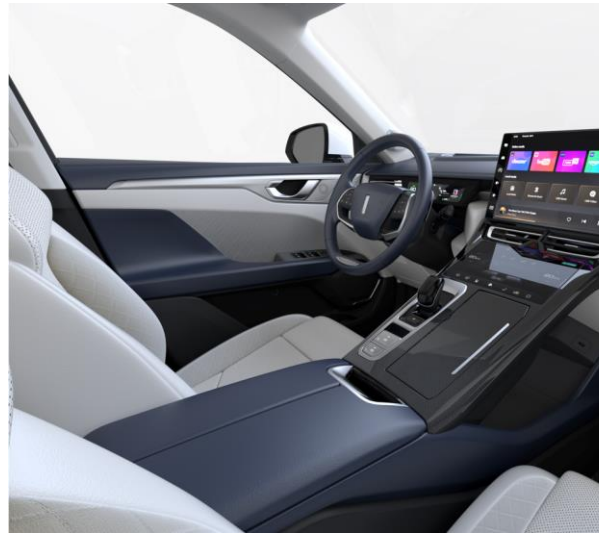
Grey/Blue optional für LUXURY