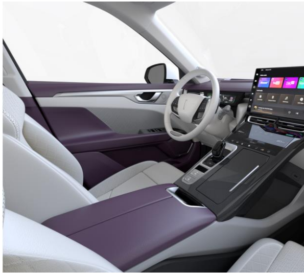
Grey/Purple optional für LUXURY