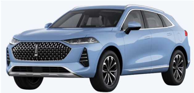
Iceberg Blue (Metallic)