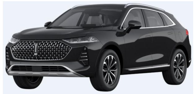
Lava Black (Metallic)