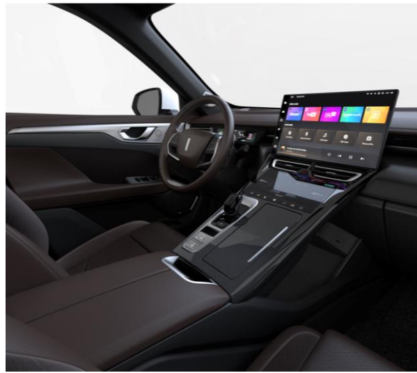
Black/Brown optional für LUXURY