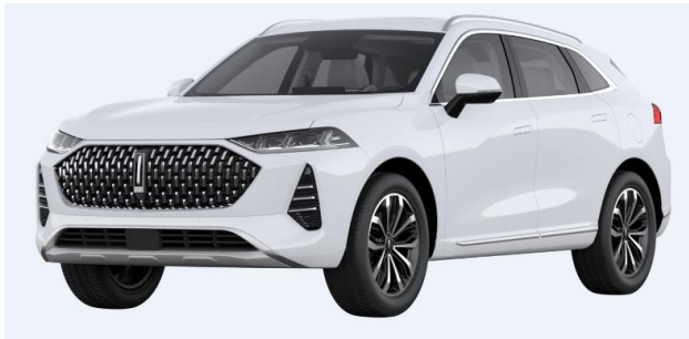
Snow White (Metallic)