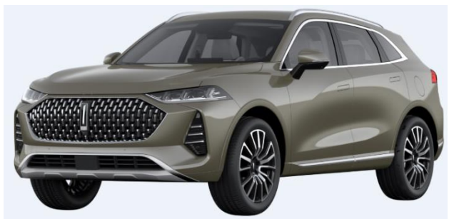
Mountain Grey (Metallic)